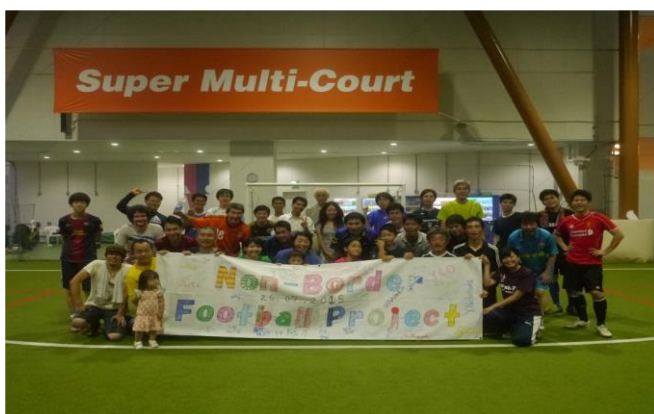
（終了後、参加者全員での記念撮影）

※当日の詳しい様子については、サロン 2002 のフェイスブックページにて公開しております。また、当日の様子を収めた動画を Youtube にて公開（Non-Border Football Project 26.07.2015 で検索）しておりますので、こちらも是非ご覧ください。